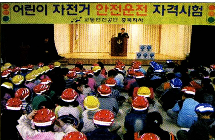
충북 음성군 맹동초등학교는 지난 2일 교통안전 교육을 실시했다.

이밖에 도내 각 지역별 13개 협의회도 11월중에 복지시설이나 어려운 이웃을 찾아 봉사활동을 펼칠 계획이어서 봉사과 사랑을 베푸는 참다운 공무원의 모습을 보여주고 있다. / 박익규