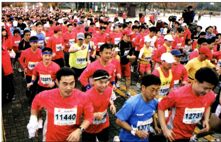
LOVE米 농촌사랑 마라톤대회 6일 서울 상암동 월드컵공원에서 열린 'LOVE米 농촌사랑 국제마라톤대회'에서 참가자들이 힘찬 출발을 하고 있다.